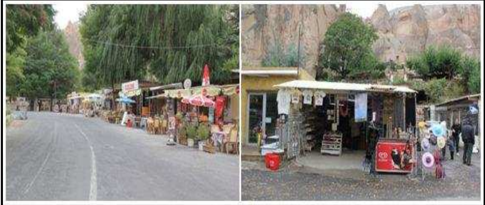
Foto 2: Zelve Açık Hava Müzesi girişinde bulunan hediyelik eşya dükkânı, kafeterya ve gözlemeciler.