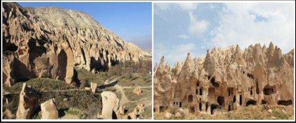
Foto 3: Zelve Açık Hava Müzesi ve dik kayalara oyulmuş meskenler.