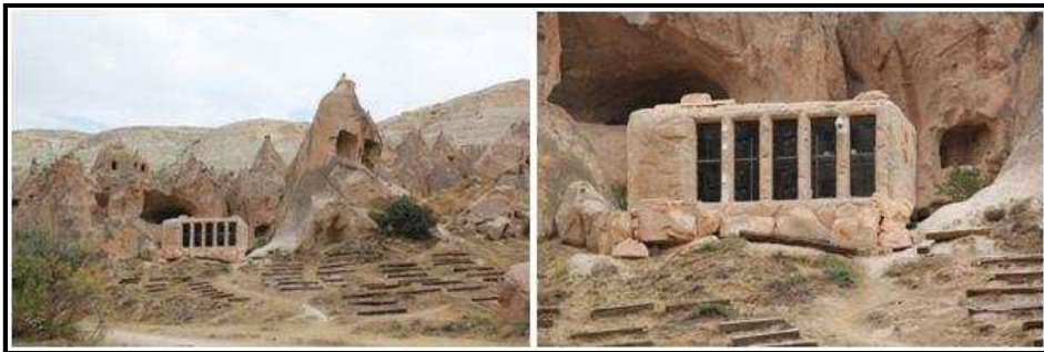
Foto 5: Zelve Açık Hava Müzesi'nde gerçekleştirilen mapping uygulama projesinin görüntü sistem merkezi.

Açık hava müzesinde mapping uygulama projesi ile saha oluşumu ve özelliklerinin anlatılacağı bir etkinlik düzenlenmektedir. Mapping uygulama projesi doğal dokuya uygun hazırlanan içerik, film ve animasyonların dokuya tam olarak uygulanması işlemidir. Bu uygulamada daha önceden belirlenmiş bir yüzeyin yapısına uygun bir şekilde görsel ve işitsel projeler hazırlanmakta ve hazırlanan yüksek kalitedeki sunumlar projeksiyon mapping olarak gösterime sunulmaktadır. Bunun için görüntü verilecek alandan 110-150 m ileride bir sistem merkezi oluşturulmuştur (Bknz: Foto 5). Bir konteynırın içerisinde düzenlenmiş olan sistem merkezi içinde bir (1) sistem bilgisayar ve 14 projeksiyon cihazı bulunmaktadır. Konteynırın etrafı bölgenin doğal dokusuna uyum sağlayacak şekilde imitasyon kaya ile kaplanmıştır. Sit alanı içerisindeki doğal dokuya zarar vermemek için konteynır, ahşap traversler üzerine yerleştirilmiştir (Nevşehir Kültür Varlıklarını Koruma Bölge Kurulu Müdürlüğü, 2015). Katılımcıların bir kısmı bu ışık gösterisinin doğal yapıya zarar vereceğini düşünürken, projeyi ekonomik açıdan değerlendirenler ise bu etkinliğin olumlu olacağını ifade etmiştir.