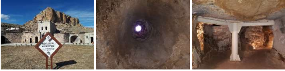
Foto 5. Mazi yeraltı şehrinin girişi, havalandırma deliği ve destek direği

mezarlar bulunmuştur. Giriş kısmında ahırlar, hayvanların su içmesine yarayan yalıklar bulunmakta; ahırlar arasında kalan bir mekân ise, şirahane olarak kullanılmıştır (Foto 5). Üzümleri aşağıya dökmeye yarayan tavan kısmında bir baca bulunmaktadır. Giriş katlarındaki ahır sayısının fazlalığı ve bu ahırların büyüklüğü o dönemde hayvansal üretimin iyi olduğunu ve ekonomik bakımdan refah bir dönemin yaşandığını göstermektedir. Ahırlardan kısa bir koridorla yeraltındaki kiliseye ulaşılmaktadır. Salon ve odalar birbirlerine dar ve uzun tünellerle bağlanmakta olup, 20 m. derinlikte su kuyusu yeraltı şehrinde bulunmaktadır. Gezilebilir bölümlerinde 26 oda, 5 salon ve 1 kilise ve ahır yer almaktadır (Demirtaş, 2015: 102; Nevşehir Müze Müdürlüğü, 2021). Yeraltı şehrine farklı yerlerden 4 giriş olduğu; ancak asıl girişin düzensiz taşlardan örülü kısa bir koridor şeklinde yapıldığı tespit edilmiştir (Kültür ve Turizm Bakanlığı, Tarihsiz-4).