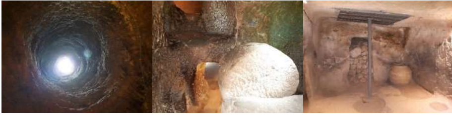
Foto 3. Özkonak yeraltı şehrinin havalandırma bacası, sürgü kapak taşı ve destek direği

Özkonak yeraltı şehrinin kaya oyma olması, onu diğer (tüf oyma) yeraltı şehirlerinden farklı kılmaktadır. Yeraltı şehri içirişindeki ışıkların iç mekân ısını etkilemesinden dolayı, duvar ve tavanlarda yosunlanma olduğu görülmektedir. Yeraltı şehri çevresinde turistik alışveriş mağazalarının olması, kasaba halkının turizme dönük olduğunu göstermektedir. Yeraltı şehrinin Gülşehir ve Avanos'tan gelen karayolları üzerinde yön levhalarının olmaması, dışardan gelen ziyaretçiler için, yeraltı şehrinin bulunmasını güçleştirmektedir.