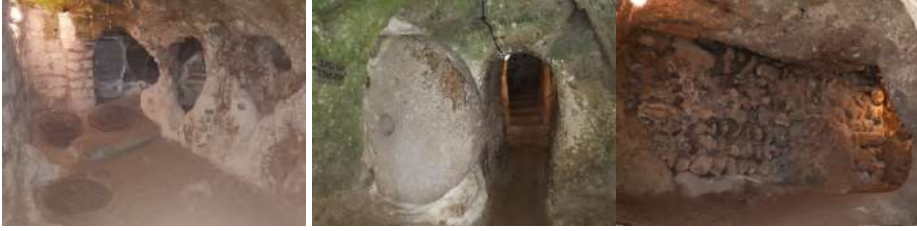
Foto 2. Derinkuyu yeraltı şehrinin sürgü kapı ve destek duvarı (Ceylan®)

Müze Müdürlüğü, 2021). 1965 yılında açılan Derinkuyu yeraltı şehrinin halen %10'u gezilebilmektedir (Kültür ve Turizm Bakanlığı, 2021b). Araştırma alanında yapılan gözlem bulgularına göre; Derinkuyu yeraltı şehri, Kaymaklı yeraltı şehrine göre daha yüksek tavanlı ve geçiş koridorlarına (tüneller) sahip olduğu görülmektedir. Geçiş koridorlarında (tüneller) giriş çıkış (yön) okları ve aydınlatmaların yeterli olduğu görülmektedir. Ancak iç mekândaki bazı odaların duvarlarına siyah yazılar yazıldığı, bazı duvarların ise kazınarak üzerine yazılar yazıldığı dikkat çekmektedir. Ayrıca yeraltı şehrinin bazı iç mekânlarında göçüklere karşı taş duvar örüldüğü görülmektedir.