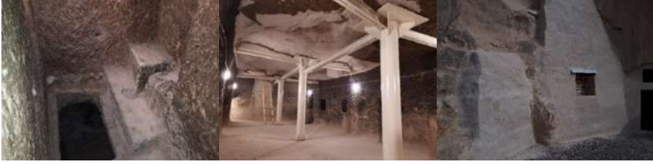
Foto 4. Tatların yeraltı şehrinin tuvaleti, destek direkleri ve kilise duvarı

bazı katlarının kaya oyma olduđu gör÷lmektedir. Nevşehir'den ve Acıgöl'den gelen karayolları üzerinde Tatların yeraltı şehrini gösteren yön levhaları bulunmamaktadır. Nevşehir'deki aktif yeraltı şehirleri içerisinde ücretsiz giriş yapılan tek ören yeri bu yeraltı şehri olmasına rağmen, ziyaretçi sayısı bakımından Kaymaklı, Derinkuyu ve Özkonak yeraltı şehirlerinden sonra gelmektedir. Yeraltı şehrinin kültür turizmi bakımından tanınan bir yer olmaması, diđer yeraltı şehirlerine göre daha kırsalda kalması ziyaretçi sayısının az olmasında etkili olmuştur.