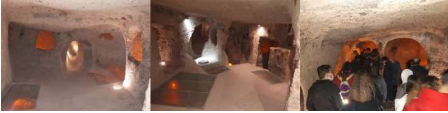
Foto 1. Kaymaklı yeraltı şehrinin iç mekânı ve ziyaretçiler

testi vb.) satış dükkânları ve tur otobüsleri için bir otopark bulunmaktadır. Çevre düzenlemesi yapılmış Kaymaklı yeraltı şehrine müze kartı ile giriş yapılmakta olup, giriş kısmında ziyaretçi bilgilendirme (tanıtım) salonu (TV sinevizyon) ve duvarda yeraltı şehrinin tarihini anlatan bir bilgilendirme levhası bulunmaktadır. Ancak bilgilendirme levhasının küçük ve yüksekte olması fark edilmesini zorlaştırmaktadır. Kaymaklı yeraltı şehri içerisinde yön (giriş-çıkış) levhalarının sökülmüş olması, iç mekânlarda ziyaretçilerin kaybolmasına neden olmaktadır. Tur operatörlerinin getirmiş olduğu yaklaşık 50 kişinin geçiş koridorları (tünel) içerisinde nefes almakta zorluk çektiği ve kapalı alan korkusu olduğu görülmüştür. Ayrıca tek bir salon (kilise ya da oda) içerisinde 50 kişiye aynı anda rehber eşliğinde bilgilendirme yapılması, iç mekânlarda ziyaretçi yoğunluğunu oluşturmakta, iç mekânın fiziksel taşıma kapasitesi üzerine çıkılmasına neden olmaktadır. Duvarlara yazı yazılmış olması, çok fazla ziyaretçi (ayak izi) nedeniyle yeraltı şehri zeminlerdeki tüflü yapılarda ufalanma olduğu görülmüştür.